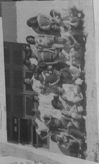
Foto: reunião de comissão