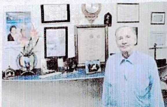
Marcelino em um momento por Palotina.

No dia 7 de março deste ano Palotina se despediu do seu primeiro prefeito eleito, Marcelino Afonso Neis faleceu aos 98 anos de idade. O pioneiro, que foi um político de muita expressão, sempre demonstrava um grande amor pelo município que ajudou a organizar. Nesta edição recontamos um pouco de sua história em reportagem que produzimos em edição especial no ano de 2004.