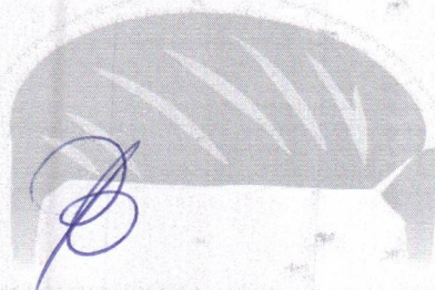
BOB FLLAY DEPUTADO ESTADUAL - PTB

Palácio Cabanagem, Assembleia Legislativa do Estado do Pará, em 30 de agosto de 2023.