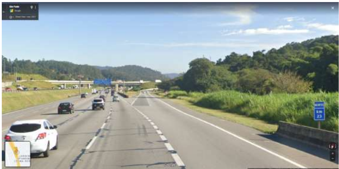
Visão do Complexo Viário visto pela Rodovia dos Bandeirantes